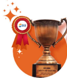
Đạt Cúp Công nghệ thông tin năm 2005 & 2006